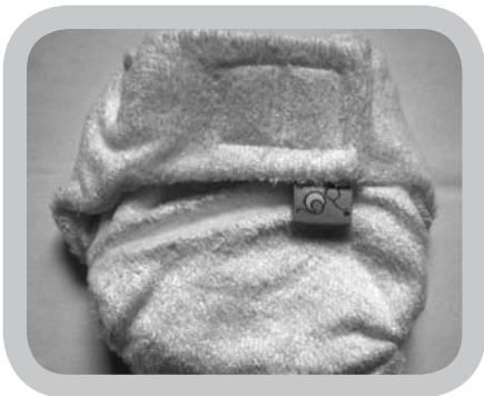
luier in bamboe