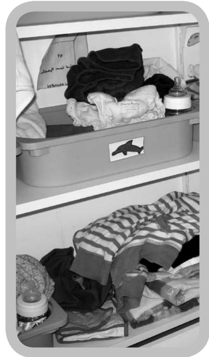
Vouw luier, inlegger en inlegvliesje samen, klaar voor gebruik, en leg ze samen met de overbroekjes bij de kleertjes.

Ook in de opvang staat men niet altijd te springen om wasbare luiers te gebruiken. Veel gehoorde tegenargumenten zijn: plaats-