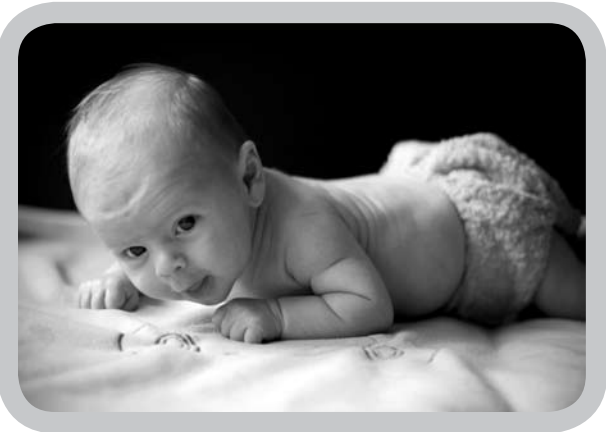
Na anderhalf jaar is de begininvestering terugverdiend.

Het ideale mag tot de verbeelding spreken, geen enkele luier is ideaal. Zowel de wegwerpluier als de wasbare luier, elk heeft een aantal plus- en minpunten voor het milieu, het gebruik, het gemak ... en vooral voor de babybiljetjes.