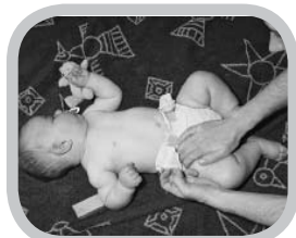
hoeveel extra werk?