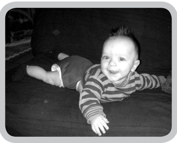
Uiteindelijk valt het extra werk met het wassen van de luiertjes wel mee...

Er waren eens een toekomstige mama en papa, beiden overtuigd dat ze ook hun steentje wilden bijdragen tot een beter milieu. Daarom besloten ze om hun toekomstige spruit "in de doeken" te leggen. Rondom hen bleken er heel wat vooroordelen omtrent het gebruik van wasbare luiers. Reacties als "amai, 't is zoals in den ouden tijd" of "je doet jezelf wat aan, maak het je toch makkelijk; wegwerpluiers zijn met reden uitgevonden", toch lieten ze zich niet doen. Ze zochten veel informatie en legden hun oor te luisteren bij o.a. een luierinfoavond en een vriendin die zelf heel wat ervaring had met een groot gamma luiers.