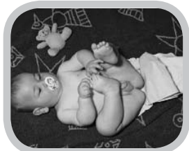
welke systemen bestaan er?