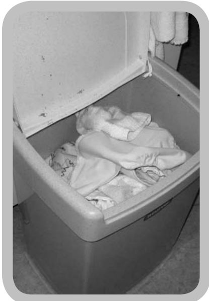
Je kunt de luiers droog bewaren of in water.

gebrek voor een luieremmer, de nood aan een extra verschooning bij sommige soorten luiers, het idee dat deze luiers vaker zouden lekken, of vaker huidirritaties zouden veroorzaken, en geurhinder met zich mee zouden brengen.