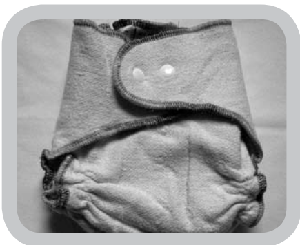
luier in hennep

De teelt van bamboe is milieuvriendelijk, omdat bamboe snel groeit, zonder pesticiden geteeld wordt, weinig water nodig heeft en CO 2 absorbeert. Maar om van bamboe viscose te kunnen maken (=de stof die men gebruikt om er luiers van te maken), zijn chemische solventen nodig. In luiers zonder label kunnen nog resten van deze solventen aanwezig zijn.