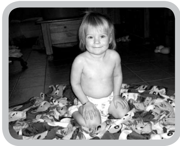
Binnen de week waren de billetjes zo goed als genezen!

Als mama van 3 kindjes en onthaalmoeder van 7 kindjes vertel ik graag hoe wij met wasbare luiers begonnen zijn.