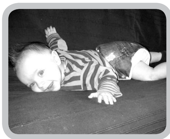
Wanneer een uitstap gepland is, gebruiken we beter absorberende luiers.