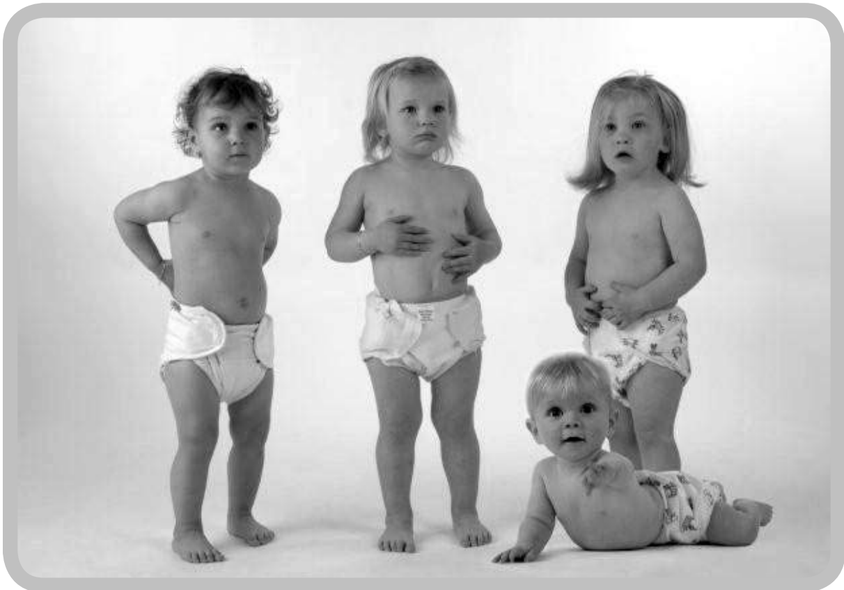
Tegenwoordig bestaan wasbare luiers in verschillende materialen