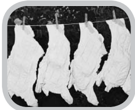
hoe zien ze eruit?