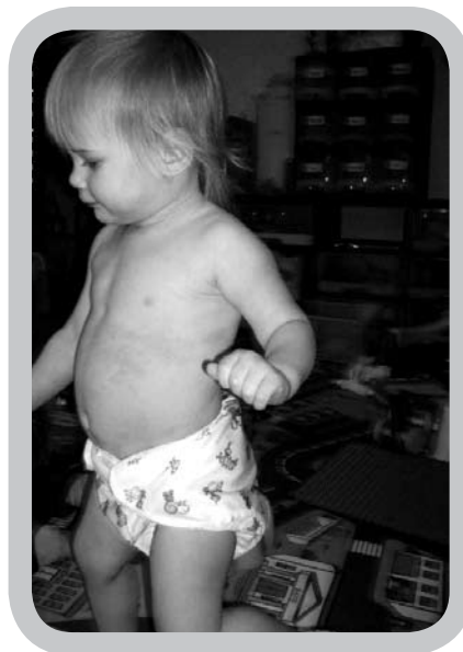
De ouders van mijn opvangkindjes zijn erg tevreden met de keuze voor wasbare luiers, het bespaart hen een hoop tijd en geld.