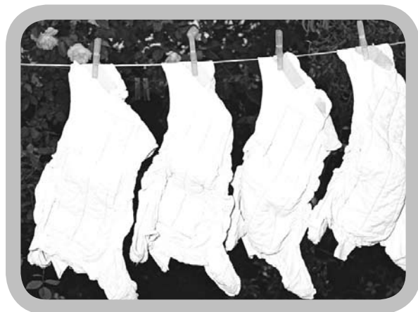
Luiers drogen aan de waslijn is milieuvriendelijker.