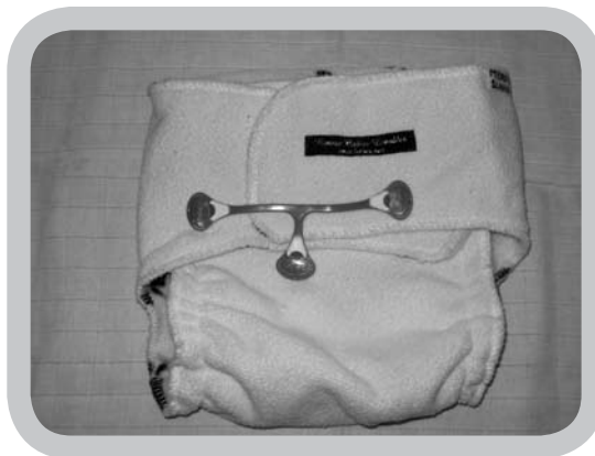
luier met luierklem

All-in-one luiers zijn erg handig voor in de opvang, voor bij de grootouders, of voor op stap.